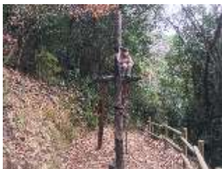
No3 龍馬の大海原眺め