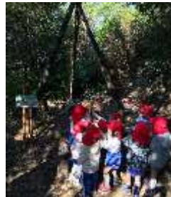
No5 山内一豊の馬揃え