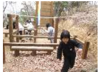
平成28年12月28日「No12 室戸の荒波」から新しくなった「No12 龍河洞探検」