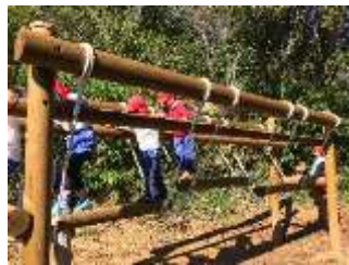
No15 シバテン流木渡り